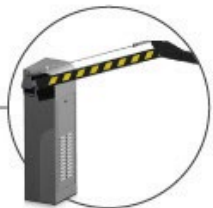
Sincronização da cancela com os semáforos