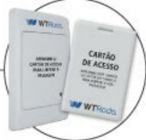
Controle de acesso por RFID