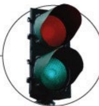
Semáforos na entrada e na saída da plataforma