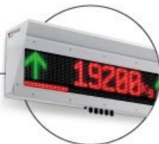
Display Remoto, com dados de pesagem e informações adicionais ao motorista