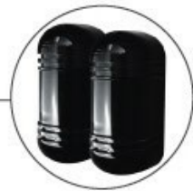
Controle da cancela com sensores de segurança