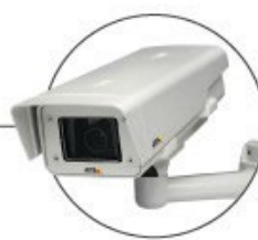
Registro da pesagem com captura fotográfica dos veículos